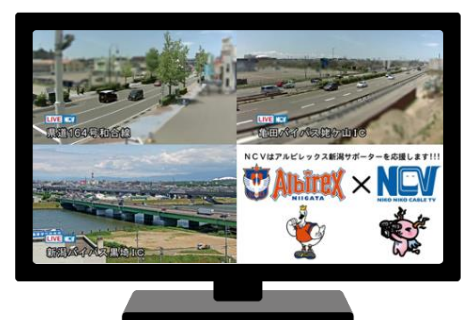
「新潟市ライブカメラ」放送イメージ

「新潟市ライブカメラ」は NCV のコミュニティチャンネル(地上波 11ch)で放送しているライブカメラ映像です。新潟市の主要交差点やバイパス及び河川、海岸の 27 カ所のカメラ映像を放送しています。